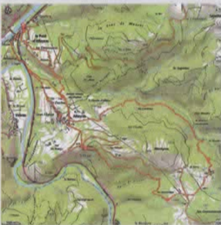
Chateau d'Agrain (J. Mazet)